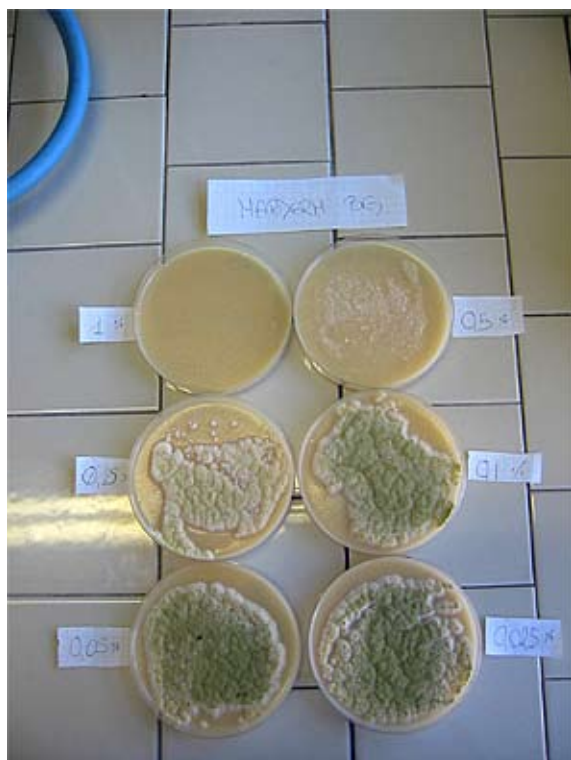
Olio 1 Terreno sabouraud Antimuffa ATX80 10%