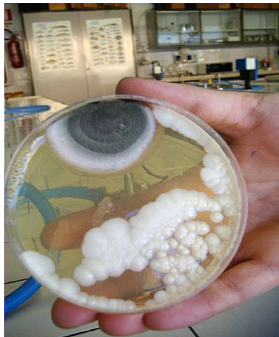
Olio 3 - SPATOLAMENTO SUPERFICIALE Terreno Sabouraud

cioè 2 terreni per ogni olio (tot 5) per l'inclusione e per lo spatolamento.