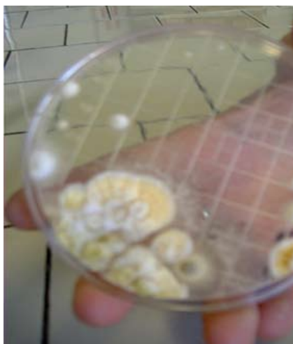
SABOURAUD MUFFA C Senza antimuffa ATX80