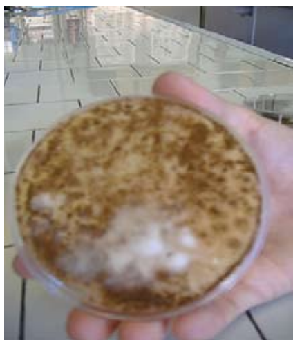
SABOURAUD MUFFA C Con antimuffa ATX80